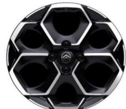
17 Zoll Leichtmetallfelgen ATACAMITE