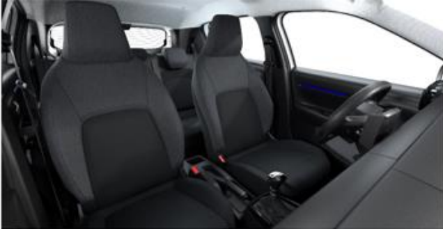
STOFF MICA GREY