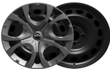
16 Zoll Stahlfelgen PYRITE