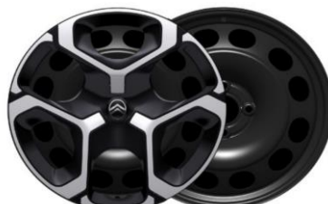
17 Zoll Stahlfelgen AZURITE