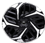
18 Zoll Leichtmetallfelgen CAMELIA 2-farbig