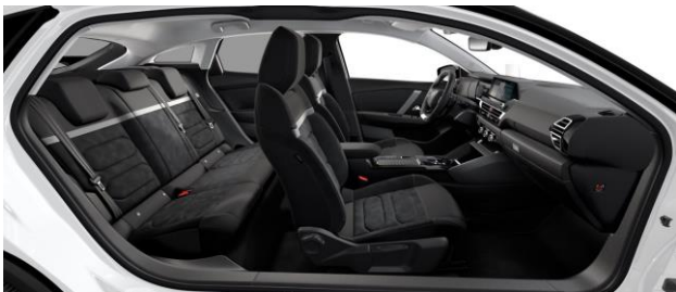
INNENRAUM URBAN BLACK