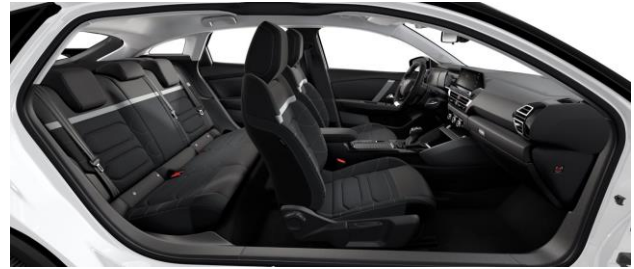
INNENRAUM URBAN GREY