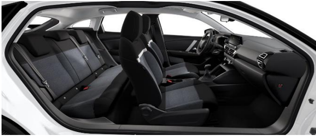
STOFF MEANWHILE SCHWARZ