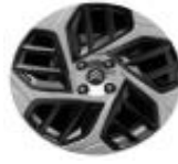
18 Zoll Leichtmetallfelgen CAMELIA grau