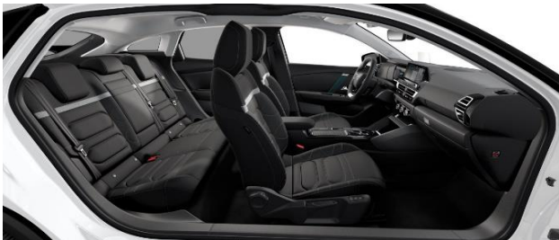
INNENRAUM HYPE BLACK