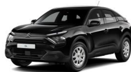
PERLA NERA SCHWARZ