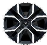
18 Zoll Leichtmetallfelgen HANOI