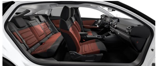
INNENRAUM HYPE RED