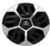
18 Zoll Stahlfelgen LOKI