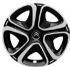
16 Zoll Stahlfelgen STEEL&STYLE