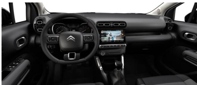
STOFF MICA GREY (SERIE)