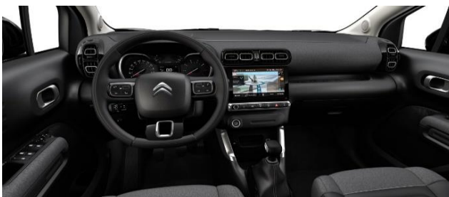
INNENRAUM METROPOLITAN GRAPHITE