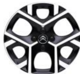
17 Zoll Leichtmetallfelgen ORIGAMI