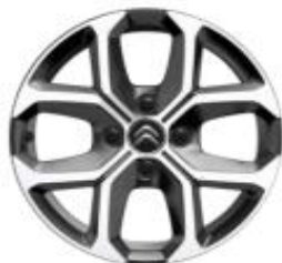
16 Zoll Leichtmetallfelgen XCROSS